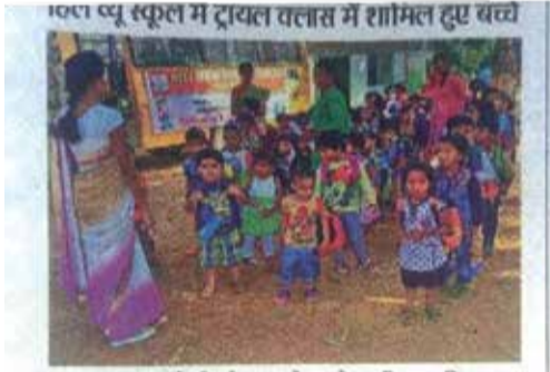
हिलव्यू पब्लिक स्कूल में आयोजित ट्रायल क्लास में काफी संख्या में नन्हें-मुने शामिल हुए। बच्चों ने कक्षा में शिक्षक-शिक्षिकाओं की बातें सुनीं और प्रश्न पूछकर अपनी जिज्ञासा सात किया। इस दौरान बच्चे बहुत खुश नजर आए। इन्हें अभिभावकों ने भी कहा कि ट्रायल क्लास को देख वे संतुष्ट हैं और वे अपने बच्चों को इसी विद्यालय में पढ़ाना चाहेंगे। विद्यालय प्रबंधन के पदधारियों ने अभिभावकों से कहा कि बच्चों का सर्वांगीण विकास उनका लक्ष्य है। नन्हें बच्चों को देश का जिम्मेदार नागरिक बनाने की दिशा में प्रबंधन तंत्रिका है।

यह उपलब्धि पूरे विद्यालय परिवार के लिए प्रेरणास्रोत है और भविष्य में शैक्षणिक उत्कृष्टता के नए आयाम स्थापित करने की दिशा में एक सशक्त कदम है।