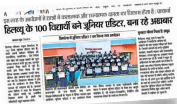
हिलव्यू के 100 विद्यार्थी बने जूनियर एडिटर, बना रहे अखबार